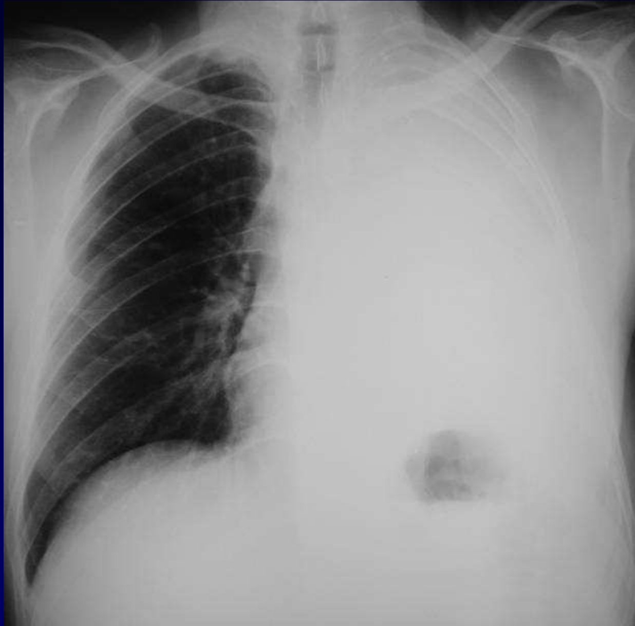
Radiographie thoracique initiale