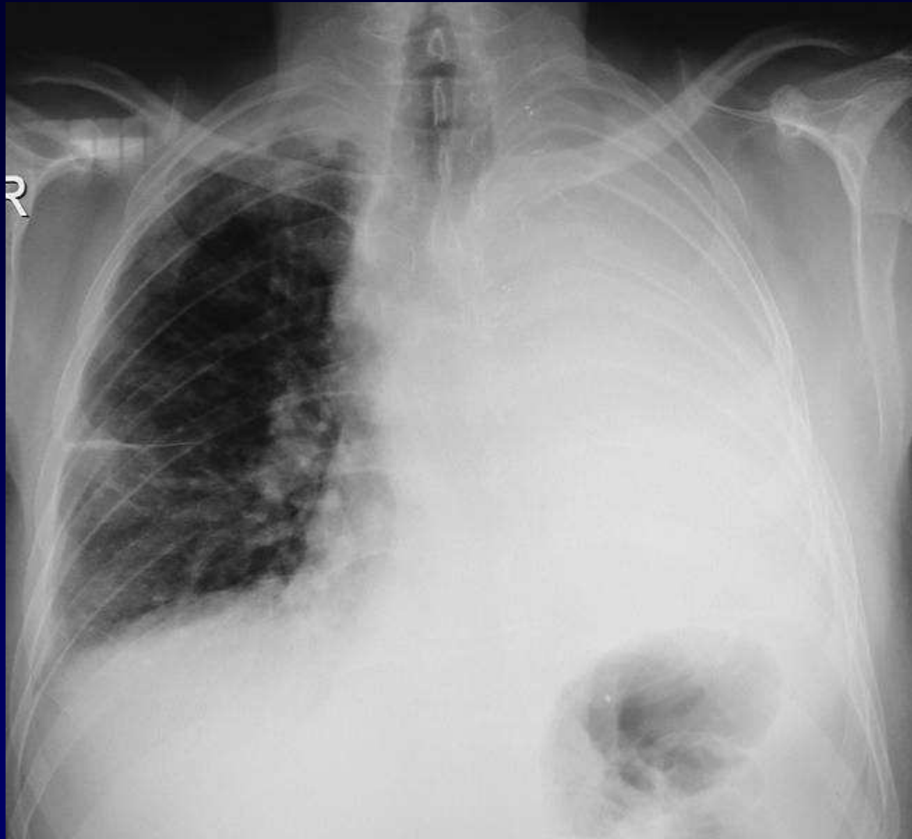
Radiographie thoracique à J+15