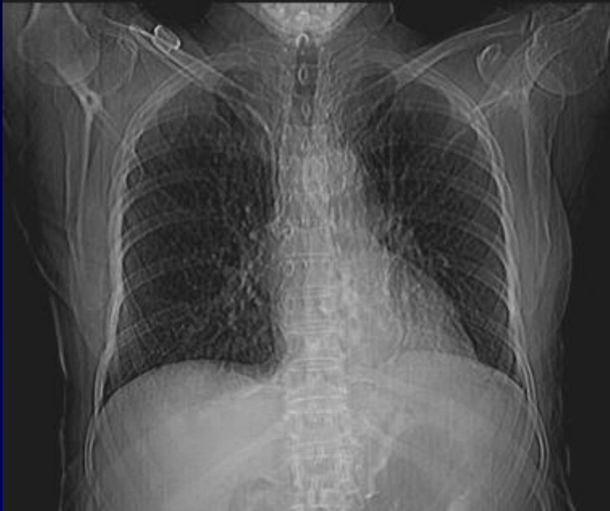
Scout view : DVI court