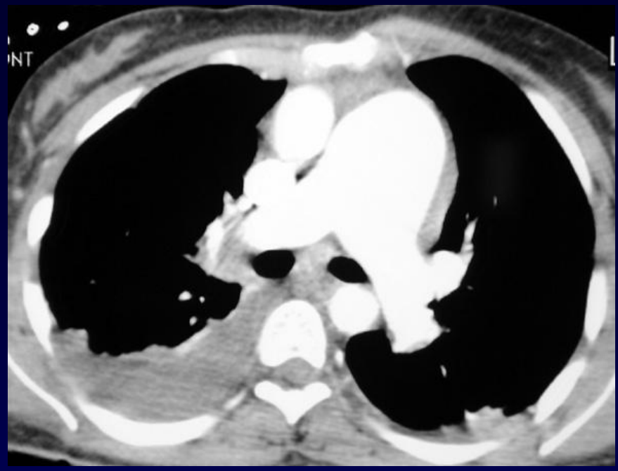
TDM avec injection de produit de contraste